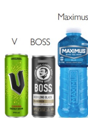
Suntory Oceania 〈オーストラリア/ ニュージーランド〉