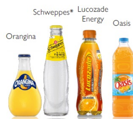
Suntory Beverage & Food EECM-Benelux 〈ベルギー/オランダ/ルクセンブルク/イタリア/ ポーランド/アフリカ諸国など〉