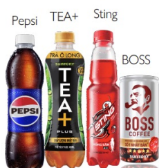
Suntory PepsiCo Vietnam Beverage 〈ベトナム〉