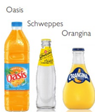
Suntory Beverage & Food France 〈フランス〉