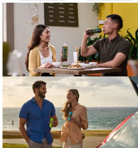
Cluster Asia 〈シンガポール/マレーシア 台湾/香港/インドネシア〉