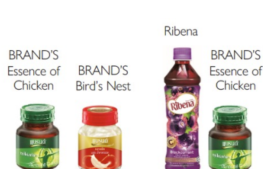
Suntory Beverage & Food Thailand 〈タイおよび周辺国〉