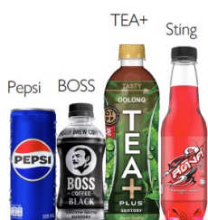
Suntory PepsiCo Beverage Thailand 〈タイ〉