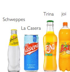
Suntory Beverage & Food Iberia 〈スペイン/ポルトガル〉