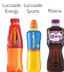
Suntory Beverage & Food Great Britain & Ireland 〈イギリス/アイルランド〉